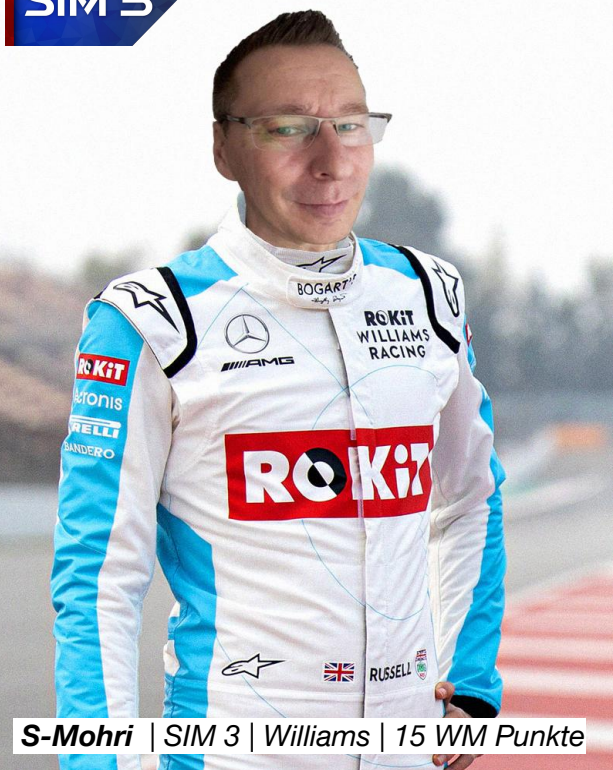
S-Mohri | SIM 3 | Williams | 15 WM Punkte