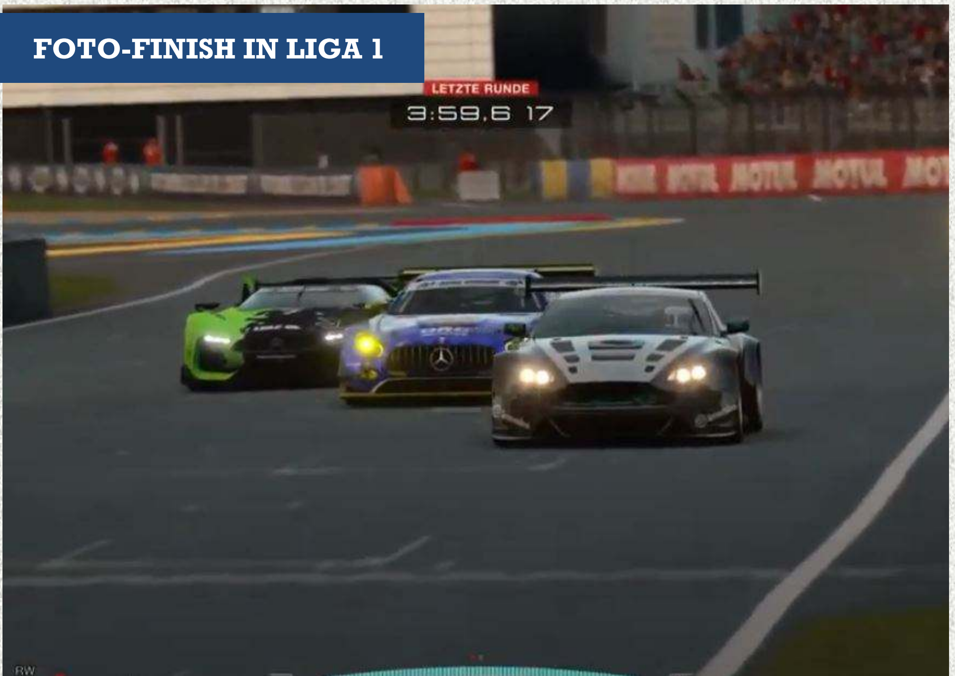
FOTO-FINISH IN LIGA 1

Ich / wir wünschen uns, dass noch möglichst viele dem Aufruf folgen werden und sagen Daumen hoch für diese Aktion, für die Academy und natürlich für alle Fahrer, die sich beteiligen!