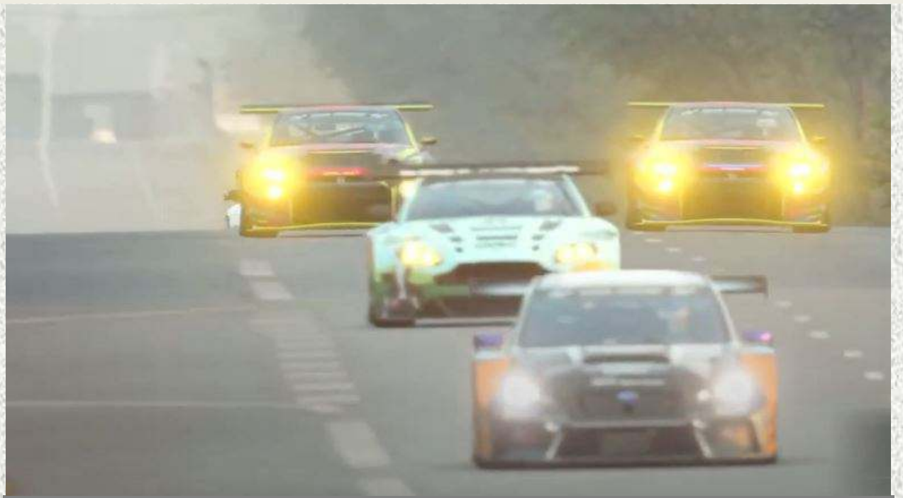
Ein-Bandit und Mac in Le Mans. Vorne: NLR_Kaliber50 und Laundry_F1

Wie der geneigte Leser natürlich bemerkt hat, ist am 14. März leider keine Raceweek erschienen. Dafür möchten wir uns entschuldigen, das entspricht natürlich nicht dem selbstgestellten Anspruch, ein regelmäßiges (!) Info-Blatt für den gesamten ORC bereitzustellen. Deshalb bietet die aktuelle Ausgabe hoffentlich genug Lese-material, um die Woche zu überbrücken. Und natürlich gilt auch weiterhin: Jeder, der sich in die Raceweek einbringen möchte, darf das sehr gerne machen. Egal ob konstruktive Kritik oder unkonstruktives Meckern, am liebsten natürlich mit Inhalten und Rennfotos, einfach in den Discord und @der_froschi anschreiben.